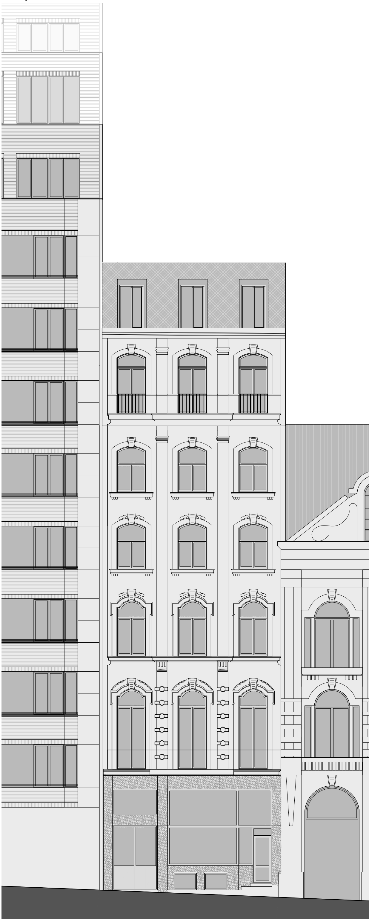
Façade avant 1/100